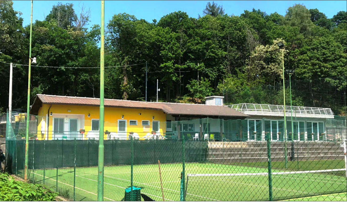
Vista fabbricato - Prospetto sud