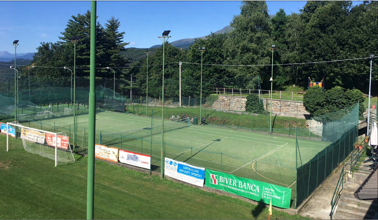
Vista del campo da tennis